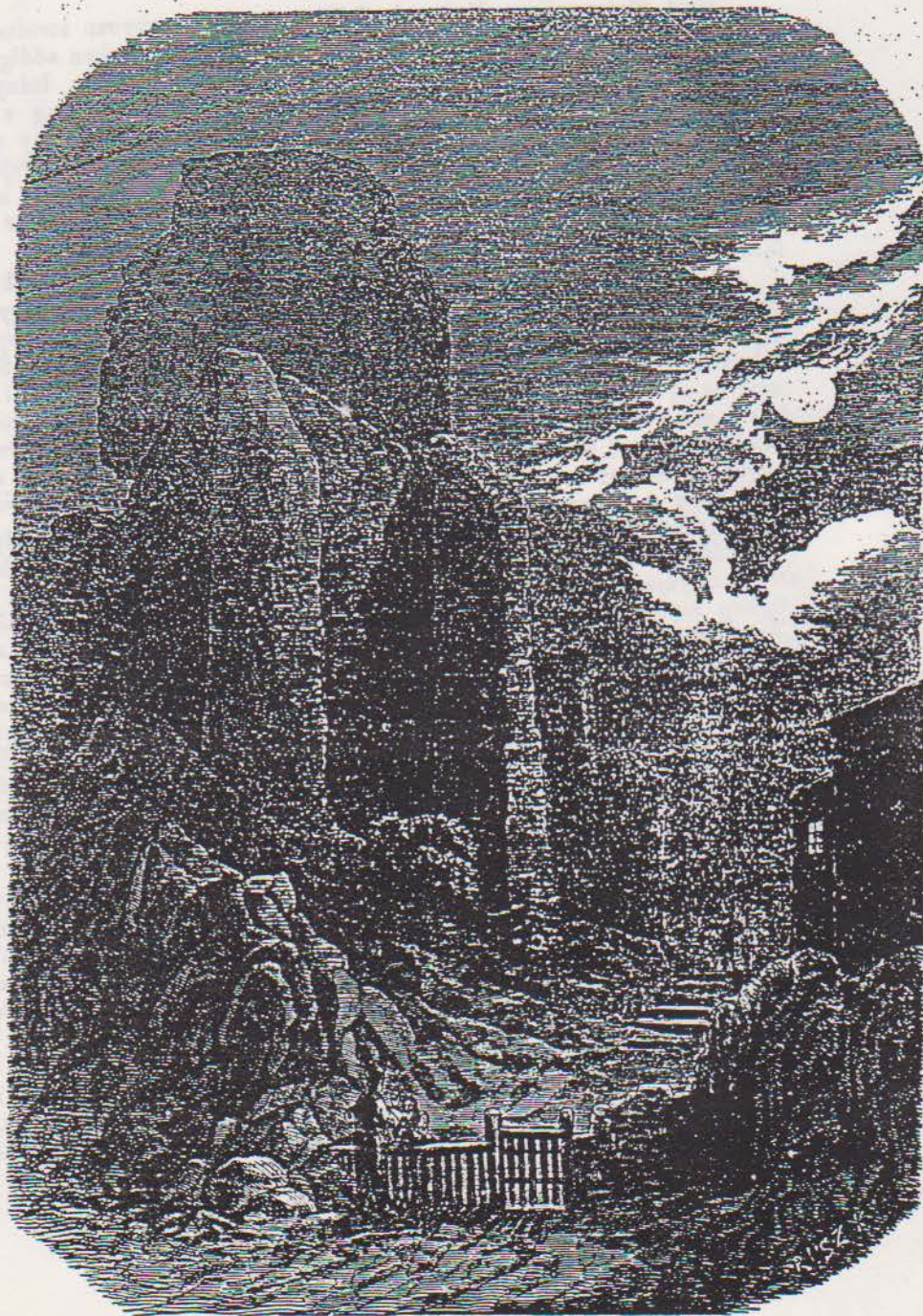
Léva vára. (Bars megyében.) — Keleti Gusztáv rajza.

Ma csupán tekintélyes rom, melynek lakható